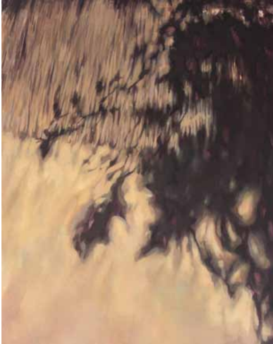
S/T Técnica mixta sobre lienzo 146 x 114 cm