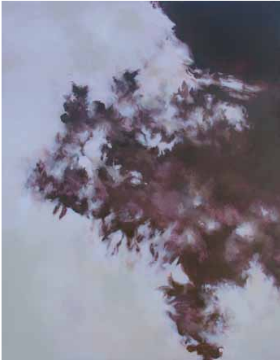
S/T Técnica mixta sobre lienzo 146 x 114 cm