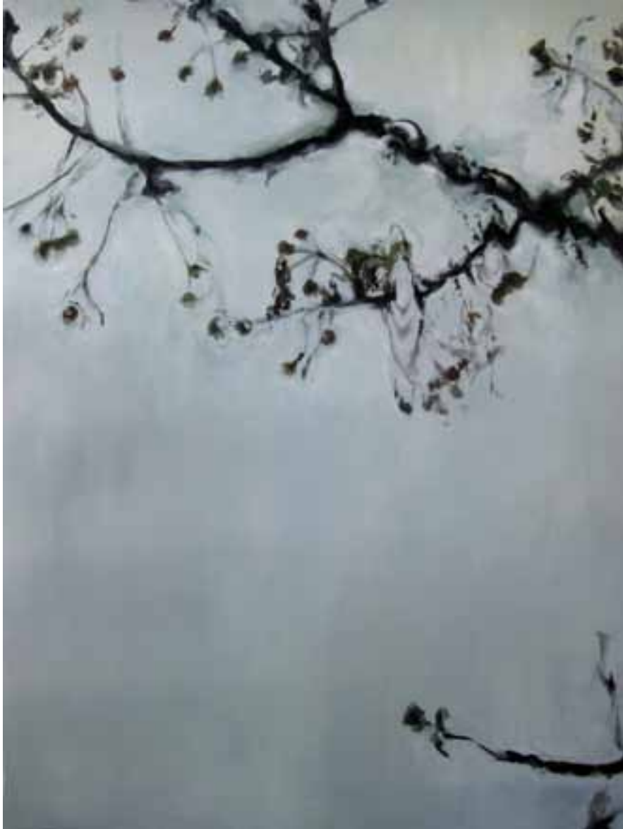
S/T Técnica mixta sobre lienzo 130 x 97 cm