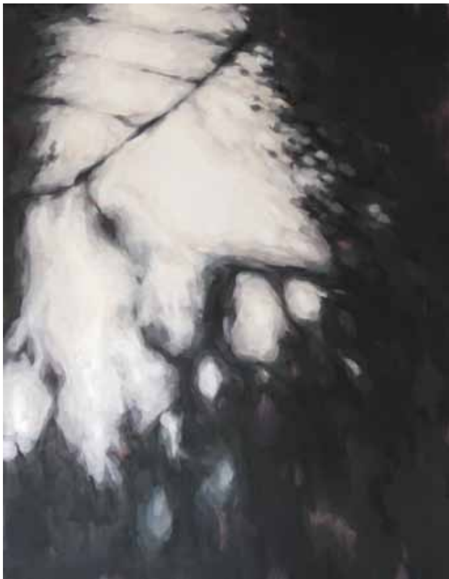
S/T Técnica mixta sobre lienzo 146 x 114 cm