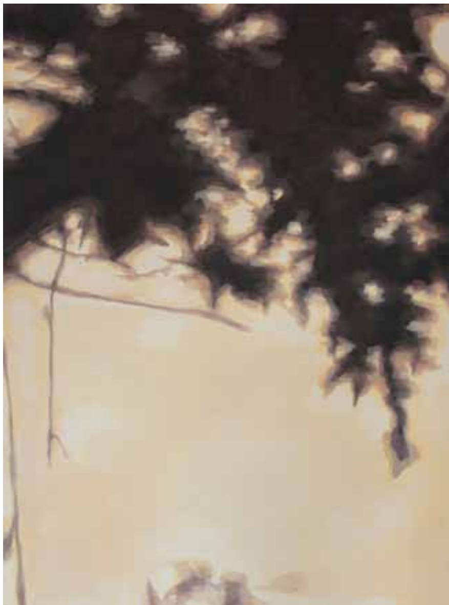
S/T Técnica mixta sobre lienzo 130 x 97 cm