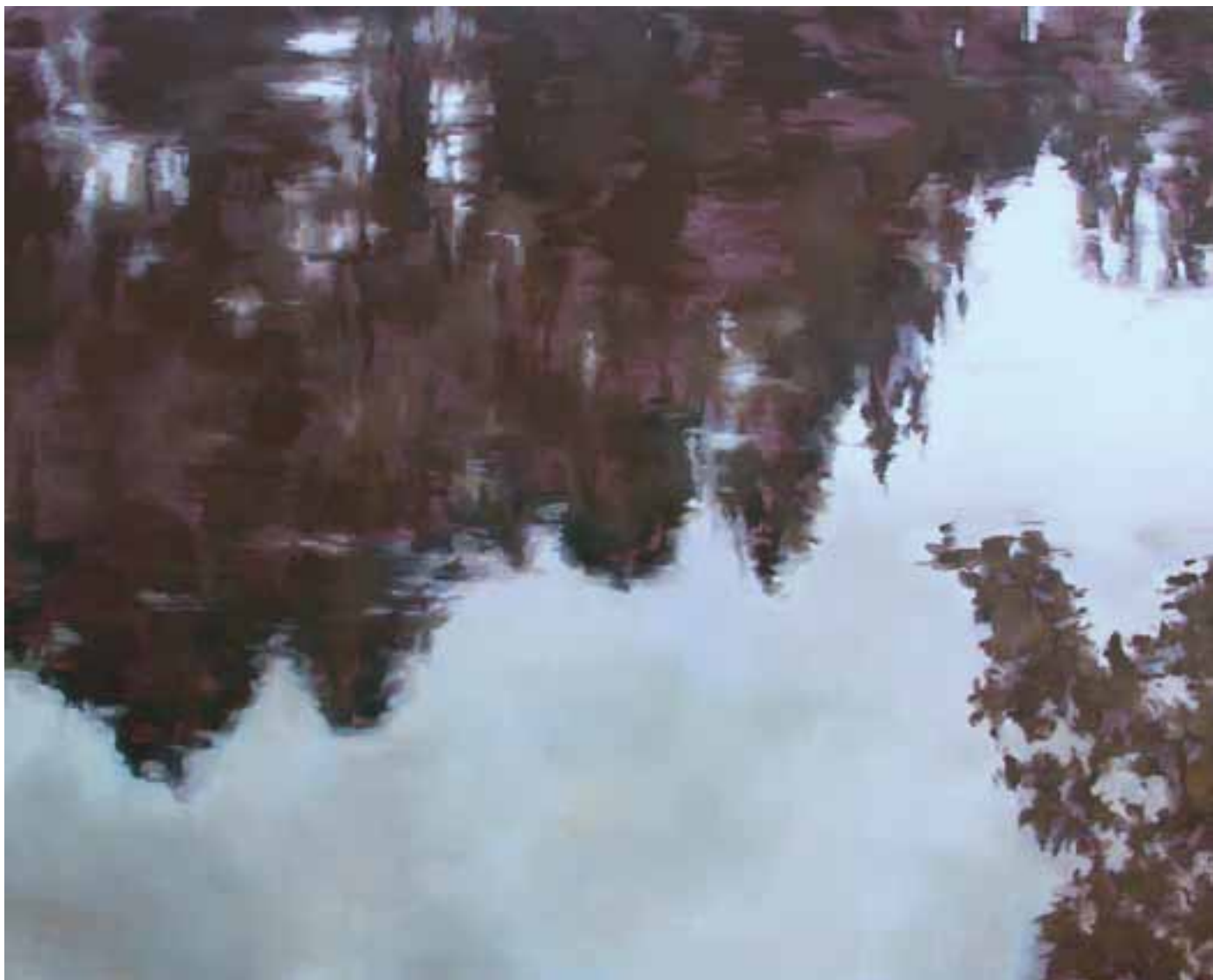
S/T Técnica mixta sobre lienzo 130 x 162 cm