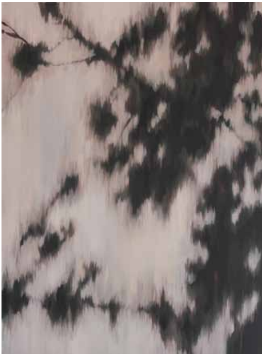
S/T Técnica mixta sobre lienzo 130 x 97 cm