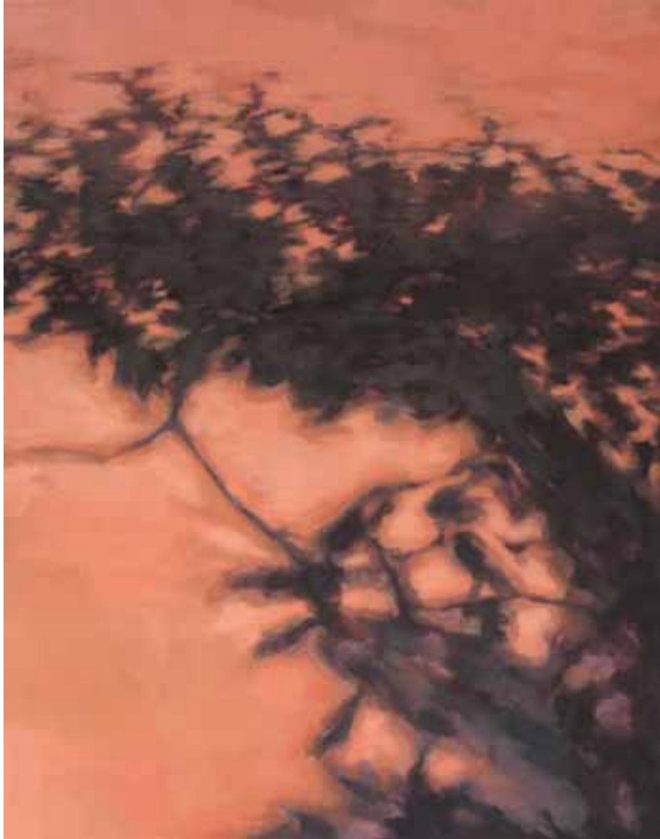
S/T Técnica mixta sobre lienzo 146 x 114 cm