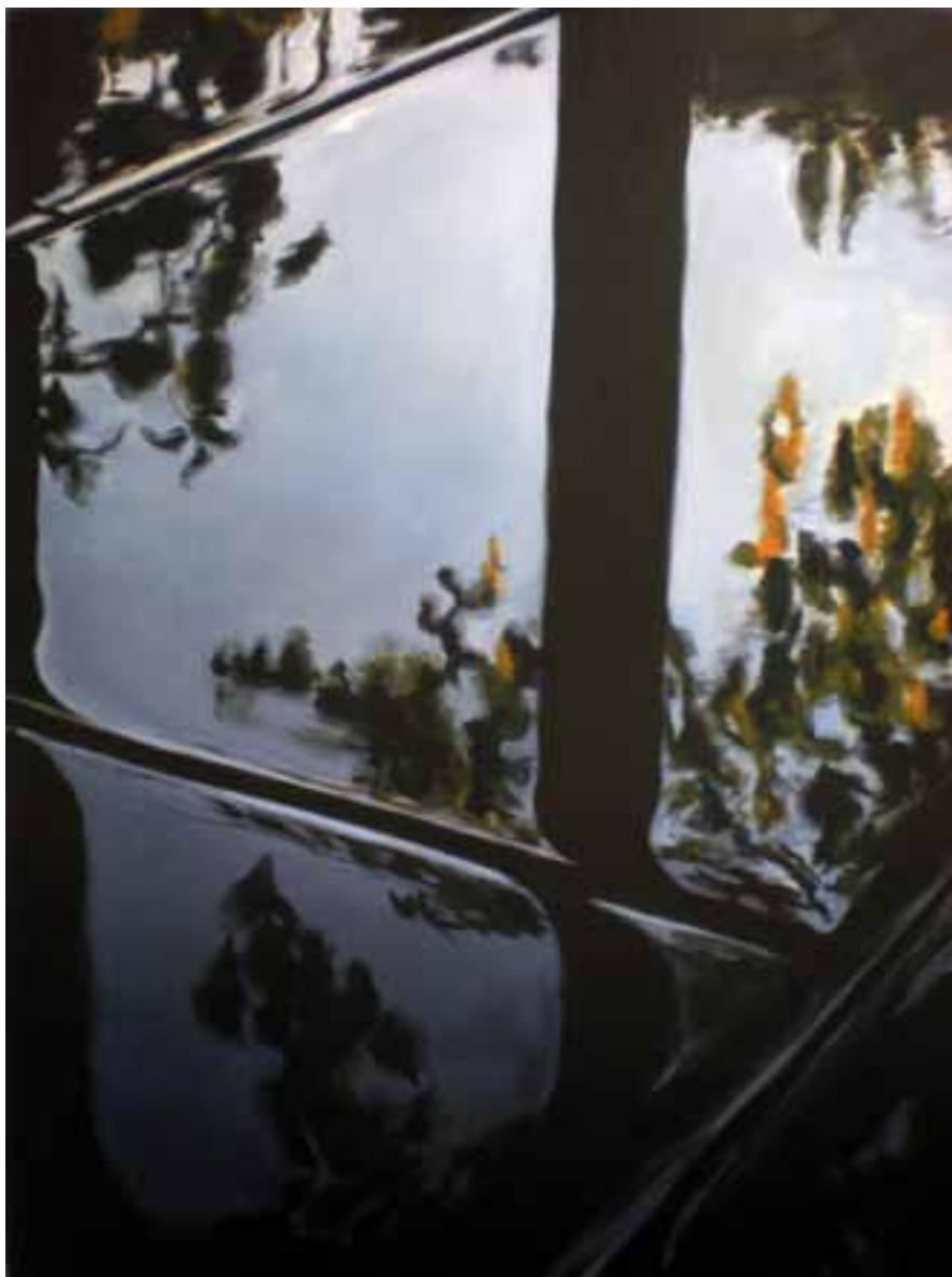
S/T Acrílico sobre lienzo 130 x 97 cm