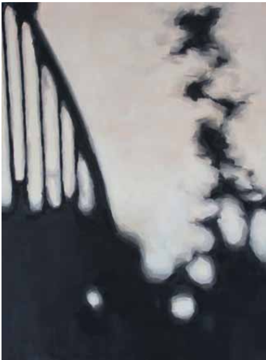
S/T Técnica mixta sobre lienzo 130 x 97 cm